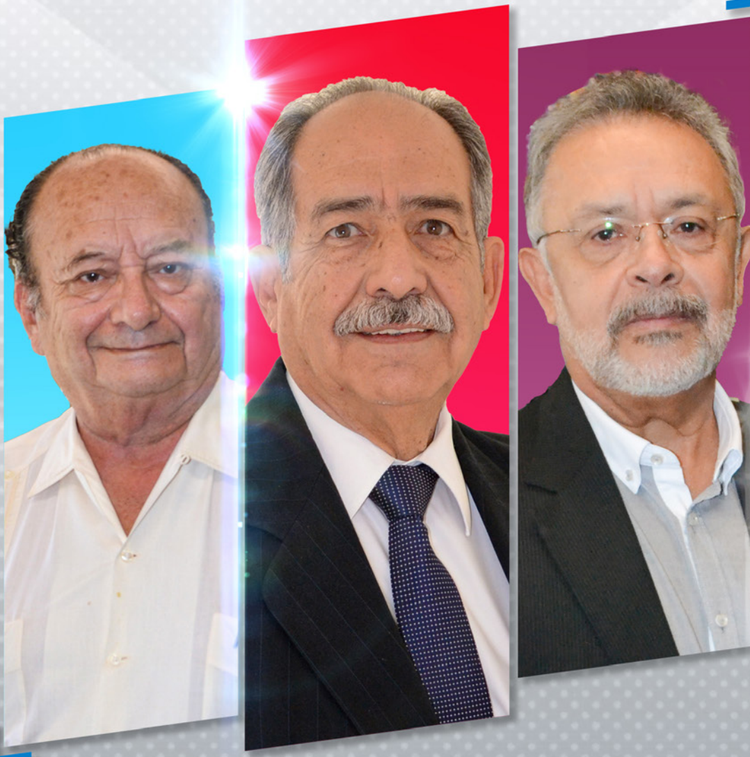
Investigadores Nacional Emérito del Conahcyt